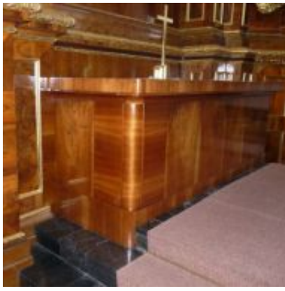
Altartisch des Hochaltars