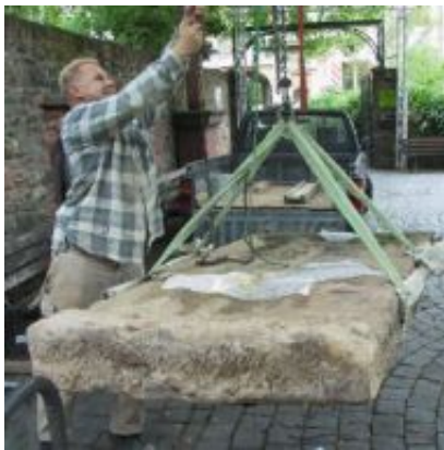
Grabmalplatte wird angehoben

Wohl seit 1930 stand das Grabmal zweier Höchster Pfarrer von 1451 für die Öffentlichkeit unsichtbar im Gärtchen am Zollturm. Zugewuchert, kurz vor der endgültigen Zerstörung durch Regen und Frost, drohte es umzustürzen. Dank der Spende der KEG Konversions-Grundstücksentwicklungsgesellschaft Frankfurt konnte der Grabstein 2008 abgebaut und restauriert werden. Jetzt steht er wieder an der Justinuskirche, von wo er ursprünglich stammte, geschützt und hoffentlich noch lange Zeit.