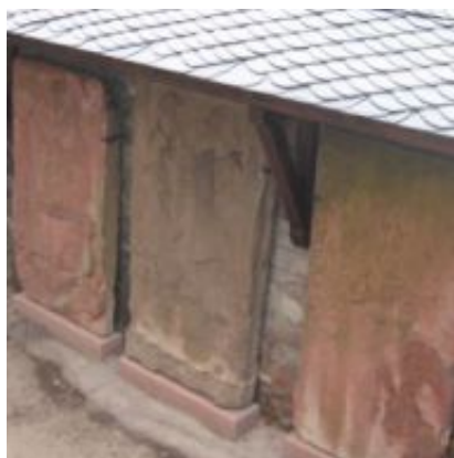
Grabmalplatten am neuen Standort

Im November 2009 konnten alle noch vorhandenen historischen Schlusssteine aus der Justinuskirche und alle Grabplatten aus dem Umfeld im Justinusgarten geschützt aufgestellt werden. Einige konnten restauriert, alle gefestigt werden. Der neue Aufstellungsort im Justinusgarten soll daran erinnern, dass dieser Garten einst der Antoniterfriedhof war und in und um die Kirche über Jahrhunderte Bestattungen stattfanden. Die Spender waren der Ortsbeirat Höchst (Transport, Festigung) und das Bistum (Zimmererarbeiten und Schieferdach).