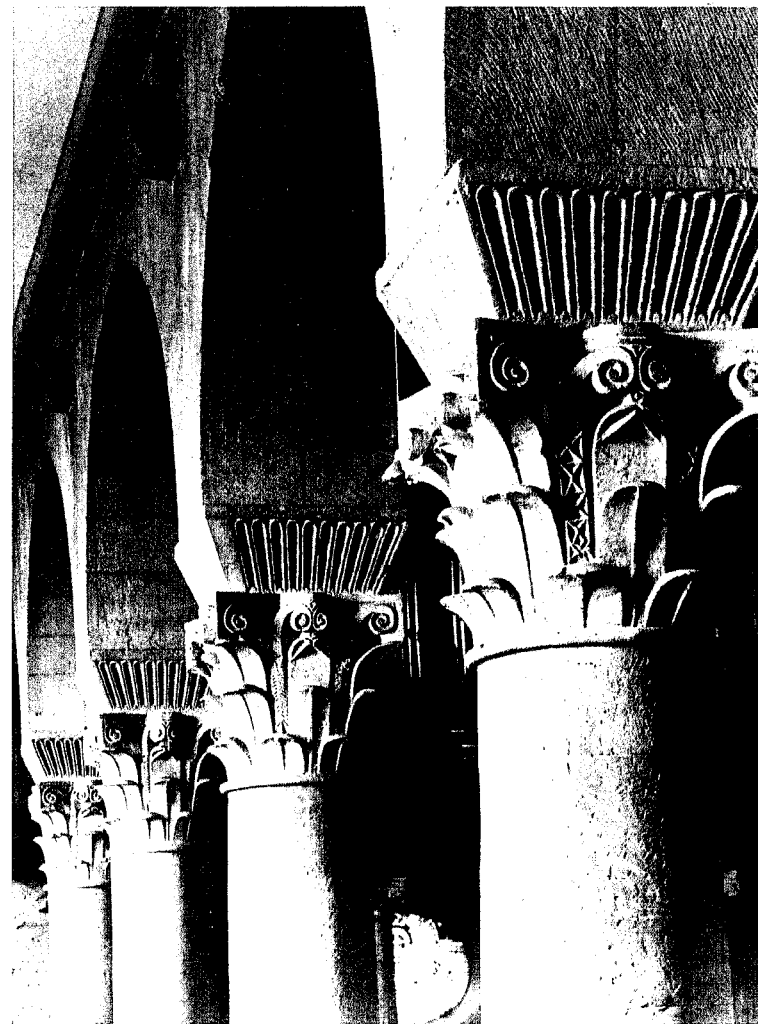
Abb. 45 Frankfurt-Höchst. Justinuskirche. Kapitelle der Südarkade

Neben der Betrachtung der karolingischen Kirche wurden die spätgotischen Anbauten des 15. und die Ausstattung des 15. bis 18. Jahrhunderts lange Zeit als qualitativ minderwertig angesehen. Dennoch bilden der von der Frankfurter Dombauhütte in der Nachfolge Madern Gertheners errichtete Chor und die Kapellen nicht nur einen wirkungsvollen Kontrast zum frühmittelalterlichen Baubestand, sondern zeigen eine überaus qualitätvolle Architektur von ruhiger Eleganz. Die Figuren des Antonius Eremita und Paulus von Theben gehören gar zum Besten, was die mittelhheinische Plastik um 1450 geschaffen hat. Dem steht die Ausstattung, überwiegend aus dem 15. und 18. Jahrhundert nicht nach. Der Kreuzaltar und die Sitzfigur des hl. Antonius, beide von 1485, der barocke